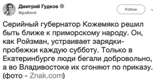
Рис. 7. Твиттер @gudkovd, 2018

Так, например, одним из наиболее популярных высказываний Гудкова в твиттере за декабрь 2018 г. является его осуждение действий губернатора Приморского края О. Н. Кожемяко, который, по словам самого Гудкова, сгоняет людей по приказу на утренние зарядки-пробежки (см. рис. 7 [20]).