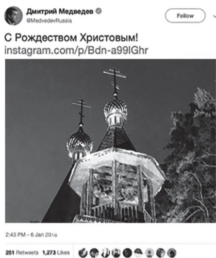
Рис. 5. Твиттер @MedvedevRussia, 2018 Fig. 5. Twitter @MedvedevRussia, 2018

Дмитрий Анатольевич старается выстроить своего рода имидж «эффективного управленца», который занимается исключительно делами государства и отчитывается перед гражданами о проделанной работе, разбавляя это поздравлениями с праздниками и поздравлениями отдельных граждан России за их выдающиеся успехи. Самым популярным твитом за январь 2018 г. (см. рис. 5 [18]) является поздравление с Рождеством. На первый взгляд может показаться, что такая «нейтральность» свидетельствует об отсутствии использования инструментов символической политики, но мы видим, что инструменты символической политики встроены в видимый конструктивный дискурс, создаваемый в социальной сети. Безусловно, такой строгий имидж имеет куда меньше шансов привлечь внимание широкой аудитории, так как отсутствует всякая сенсационность заявлений, что делает социальную сеть скорее ретранслятором уже существующего курса политика.