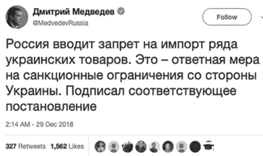
Рис. 6. Твиттер @MedvedevRussia, 2018 Fig. 6. Twitter @MedvedevRussia, 2018

Необходимо понимать, что за Медведевым уже закрепился определенный символический образ довольно нейтрального политика, а резкой необходимости смены символического образа для приобретения нового электората пока не наблюдается, поэтому социальные сети служат дополнением к уже создавшемуся образу. Нельзя сказать, что этот метод символической политики в социальных сетях однозначно неэффективен – среди российских политиков Дмитрий Медведев является одним из наиболее часто упоминаемых в СМИ. Самое популярное высказывание за декабрь 2018 г. в твиттере (см. рис. 6 [19]) также носило нейтральный характер и не было направлено на некую сенсационность. Выстраивается дизайн коммуникации, который напоминает отчет главы компании о проделанной работе, представляемый акционерам. В свою очередь, лента политика в социальной сети «ВКонтакте» продолжает уже выявленную нами тенденцию к апеллированию к деловому формату публичных дискуссий.