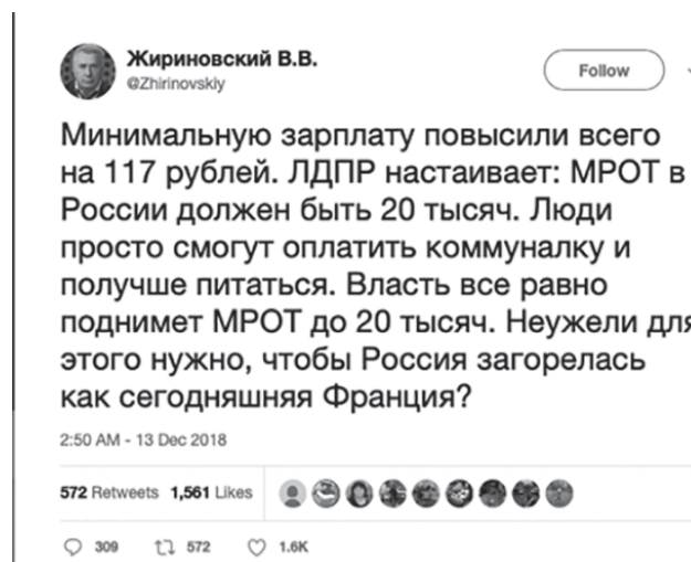
Рис. 1. Твиттер @Zhirinovskiy, 2018 Fig. 1. Twitter @Zhirinovskiy, 2018

В случае Жириновского первый твит появляется 18 января 2018 г. Его первые посты были ориентированы исключительно на то, чтобы создавать некий информационный фон, содержа в себе либо видеофрагменты выступлений Владимира Вольфовича, либо просто типовые анонсы программ по ТВ, в которых он участвовал. Первым постом за январь, нашедшим наибольший отклик среди читателей твиттера Жириновского, стал следующий твит (см. рис. 1 [14]). Он был посвящен выборам президента и содержал популистскую идею о том, что нужно вернуть российские деньги из-за рубежа и заставить их работать на нашу экономику.