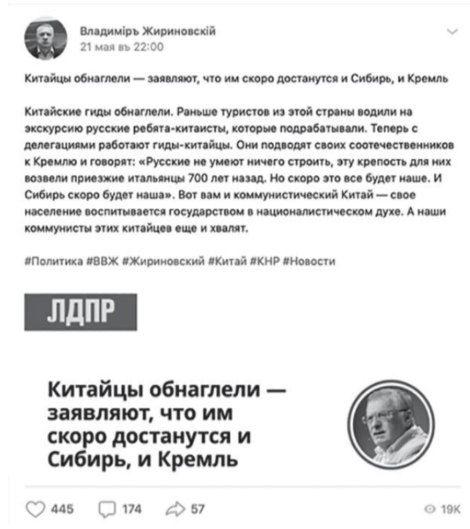
Рис. 3. Страница В. В. Жириновского в «ВКонтакте», 2019 Fig. 3. V. V. Zhirinovskiy, “VKontakte”, 2019