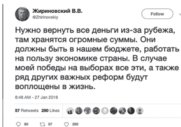
Рис. 2. Твиттер @Zhirinovskiy, 2018

Как мы видим, в данном высказывании отсутствуют какие-либо конкретные шаги, которые бы Жириновский собирался предпринять в случае победы на выборах, поэтому этот пост направлен исключительно на создание символического образа такого политика, который солидаризируется с вопросами своих соотечественников к власти и готов их решать, пускай и непонятным нам способом. Жириновский переключился полностью на формат коротких высказываний, которые не носят никакого аналитического характера, а нацелены исключительно на закрепление устойчивых смыслов посредством систематического ретранслирования умеренно-оппозиционных взглядов. Об успехе данной стратегии свидетельствует и содержание самого популярного высказывания Жириновского за 2018 г. (см. рис. 2 [15]), которое набрало около 1 600 отметок «нравится» против 290 у первого осужденного поста.